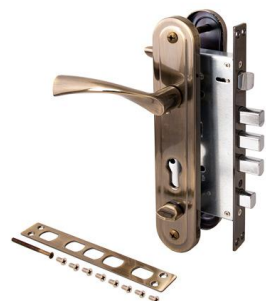
Замок врезной Avers T-0523-C-AB-R