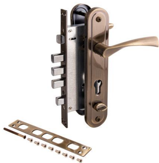
Замок врезной Avers T-0523-C-AB-L